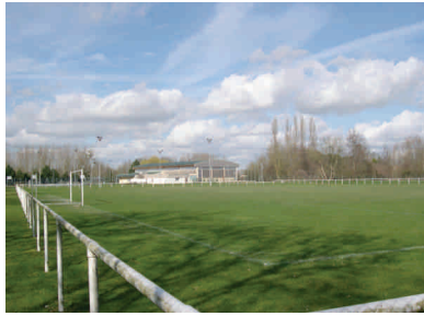
L'ensemble sportif communal.

Aménager un espace de transition entre le tissu urbain nouveau et l'espace agricole et prendre en compte les situations d'entrée de ville. Constituer une limite d'urbanisation à long terme qui assure l'interface entre l'espace urbanisé et l'espace agricole.