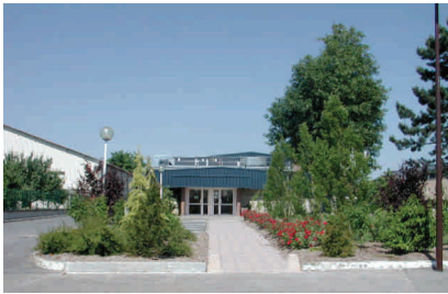
La salle des fêtes

La commune dispose d'un bon niveau d'équipement et de services pour répondre aux besoins des populations en matière, notamment, d'éducation, de loisirs, de santé, de commerces, ainsi que la proximité avec le centre commercial et ludique de Châlons St-Memmie