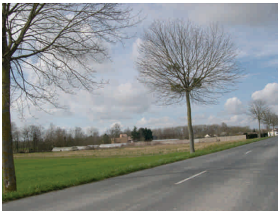
L'agriculture en frange urbaine

La commune souhaite préserver sa richesse agricole. Cette dernière engendre en effet, outre ses propres emplois, des emplois induits. Par ailleurs, si la production reste son objectif essentiel, l'affirmation de la vocation agricole des sols permet également de fiabiliser les paysages et d'entretenir les espaces ruraux de la commune dans le respect de l'environnement.