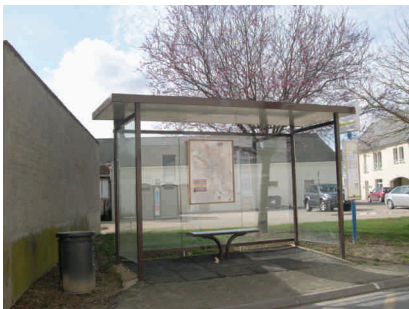
Abribus rue Haute / Place du Commerce