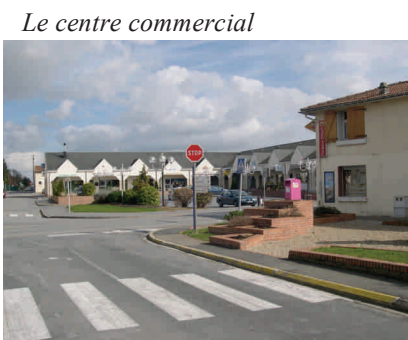
Le centre commercial

Constituer, au coeur du village, un "mini pôle" de commerces et de services en s'appuyant sur le centre commercial existant et en complétant l'offre.