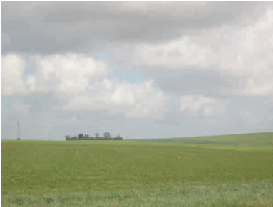
Bosquets de superficie réduite et alignements plantés le long des voies jouent un rôle paysager de premier ordre dans l'espace agricole.