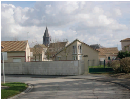
Des formes urbaines variées mais qui restent à une échelle villageoise

La commune souhaite aujourd'hui profiter de cette opportunité de structuration de son territoire en renforçant les quartiers Sud et Est. Il s'agira d'ouvrir de nouveaux espaces à l'urbanisation mais aussi de favoriser la construction dans des secteurs qui ont historiquement constitué le village et qui forment les moteurs du développement et de l'animation de Sarry. Le tracé de la (ou des) lignes devant s'adapter au fur et à mesure aux développements urbains nouveaux.