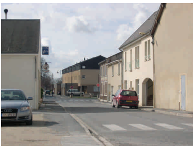
La rue du Thermot articule tout un ensemble de fonctions urbaines majeures.