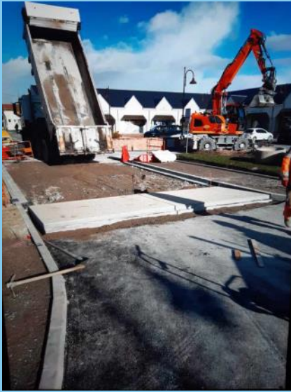
Les travaux de la Grande rue touchent à leur fin. Premiers retours en images...