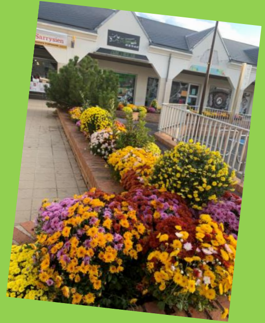
Les employés communaux ont permis à la place du Commerce de retrouver de belles couleurs en ce début d'automne