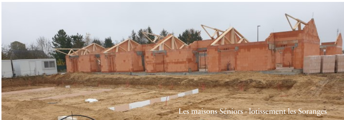
Les maisons Séniors - lotissement les Soranges