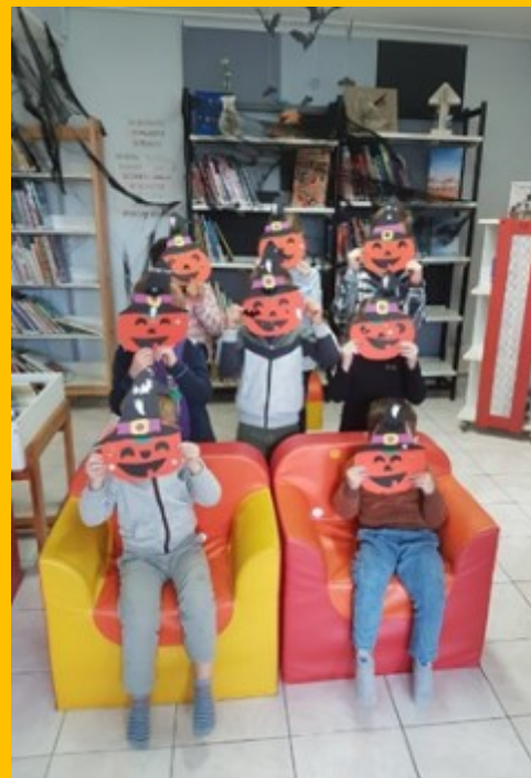
La bibliothèque renovée a accueilli Halloween

Horaires d'ouverture Lundi : 16h à 18h Mercredi : 14h à 17h Jeudi : 14h à 17h Samedi : 14h à 16h