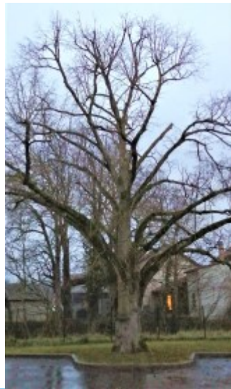
Le remplacement de l'arbre de la liberté