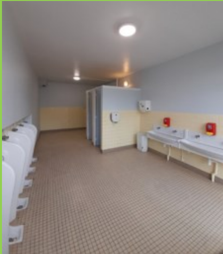
Réfection de la partie sanitaire

Les travaux effectués par les services techniques au groupe scolaire