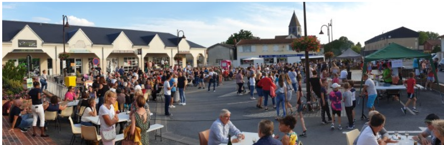
L'apéro gourmand, le 2 juillet 2021