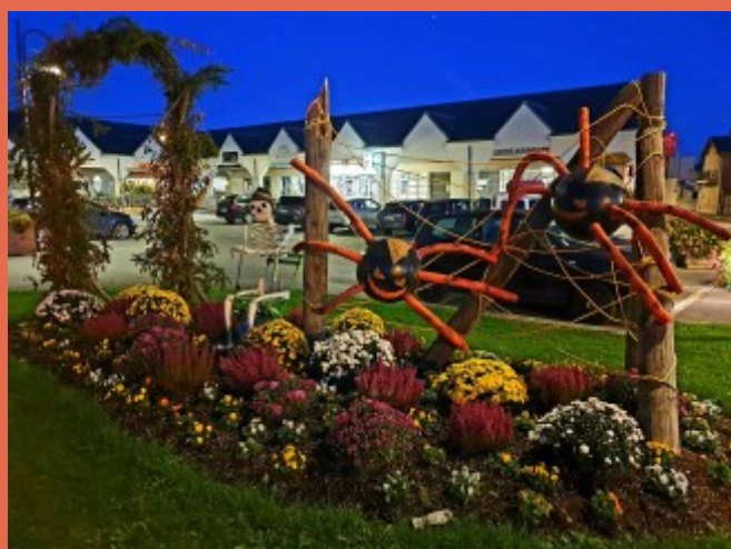
Sarry aux couleurs d'Halloween, fin octobre