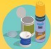
canettes, conserves, couvercles de bocaux et aérosols