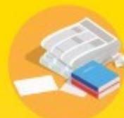
magazines, journaux, publicités, courriers, cahiers...