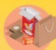
sacs, boîtes de céréales et gâteaux...