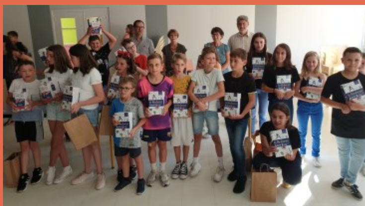
Juin 2022, la traditionnelle remise des dictionnaires aux futurs collégiens