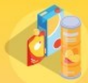
briques alimentaires, gourdes de compote, sachets et boîtes de chips...