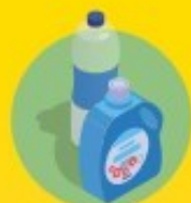
bouteilles et flacons