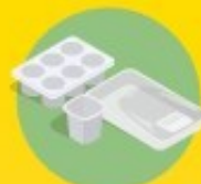
pots, boîtes et barquettes alimentaires