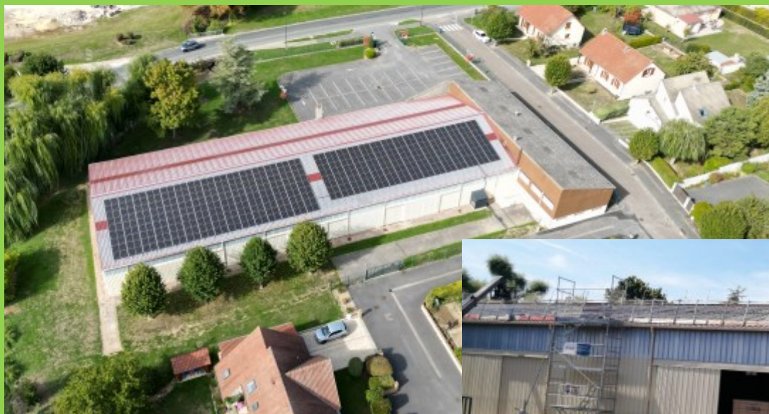
L'installation des panneaux photovoltaïques sur le toit du club omnisports