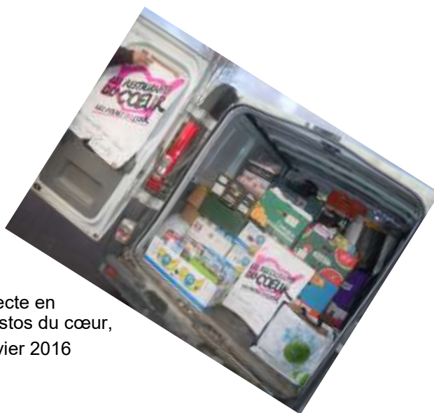
La collecte en faveur des Restos du cœur, le 16 janvier 2016