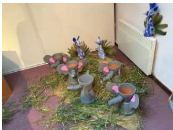
Exposition « Les mots d'animaux - le zoo » Bibliothèque du 1er au 30 juin 2016