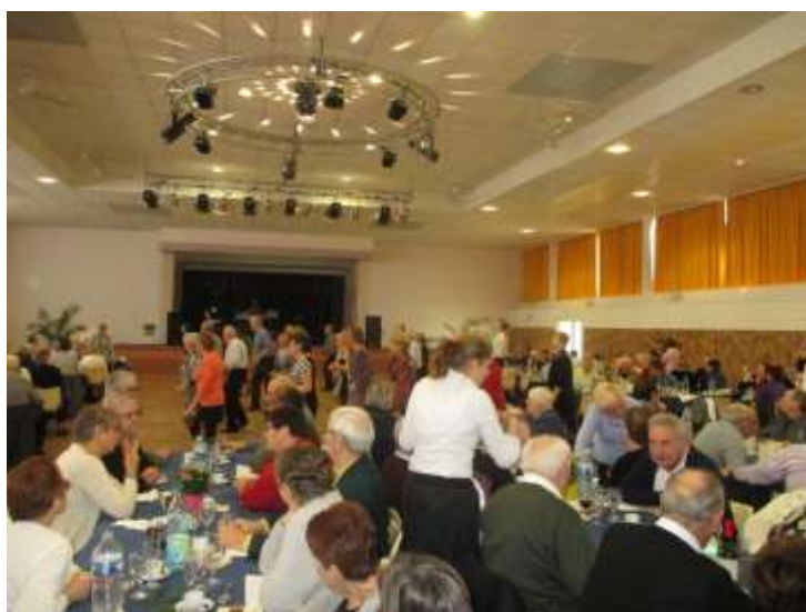
Repas des anciens, le 17 janvier 2016