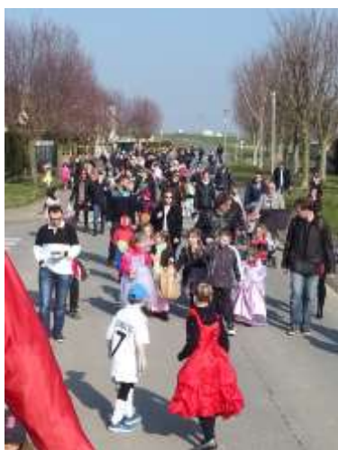
Carnaval, le 12 mars 2016