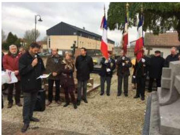
Cérémonie de commémoration du 11 Novembre