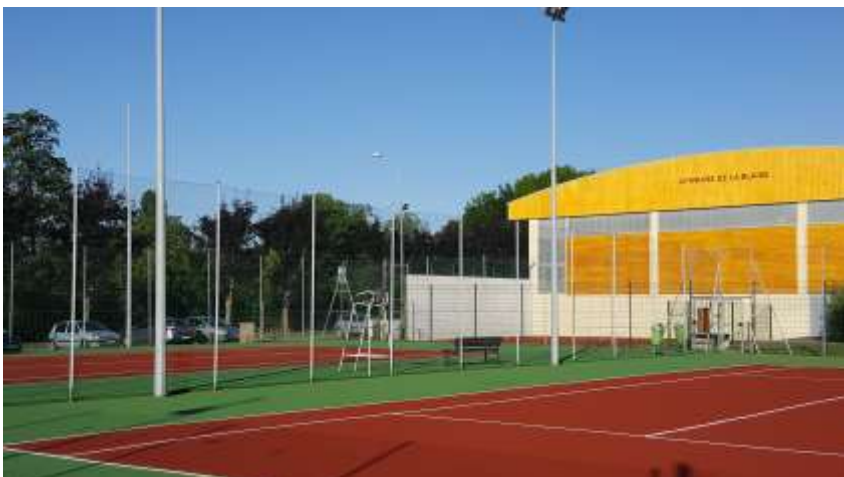
Les courts de tennis et le gymnase après réfection