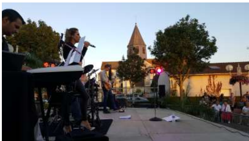
Concert d'été - août 2016