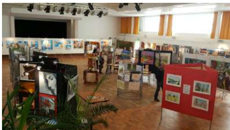
Exposition de peintures et dessins - octobre 2016