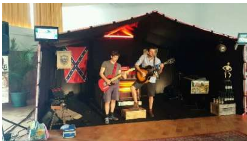
Théâtre de routes - juin 2016