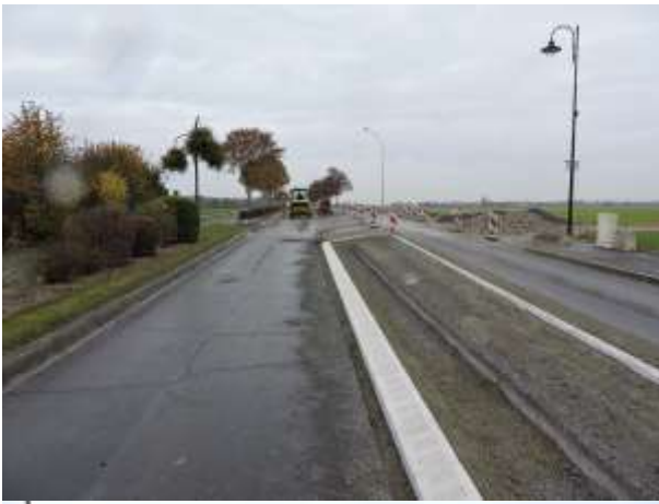
Les travaux, de sécurisation, entrée de Sarry, côté Châlons-en-Champagne