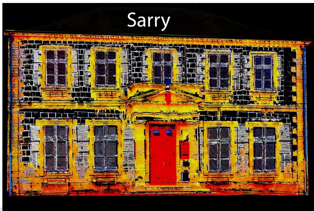
Photo extraite du spectacle du 18 juillet 2014