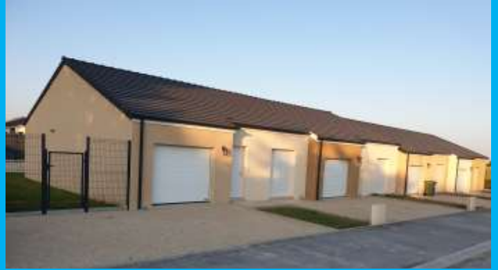
Les maisons séniors