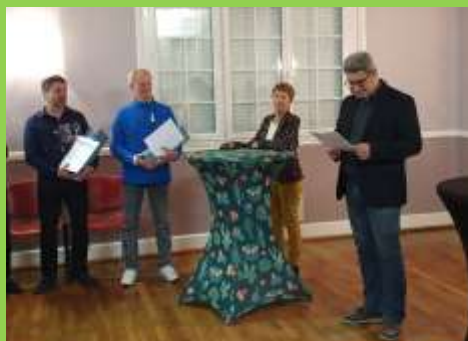
Remise des médailles du travail