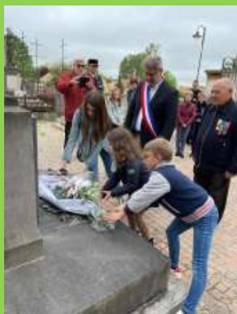
Commémoration du 8 mai 1945