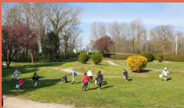
La chasse aux œufs de Pâques