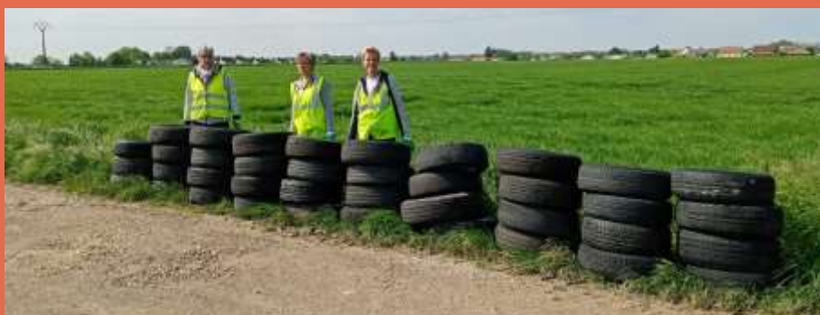
Matinée Environnement 37 pneus ramassés en bordure de la RN44 !