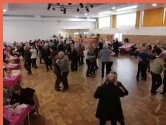
Le repas des aînés