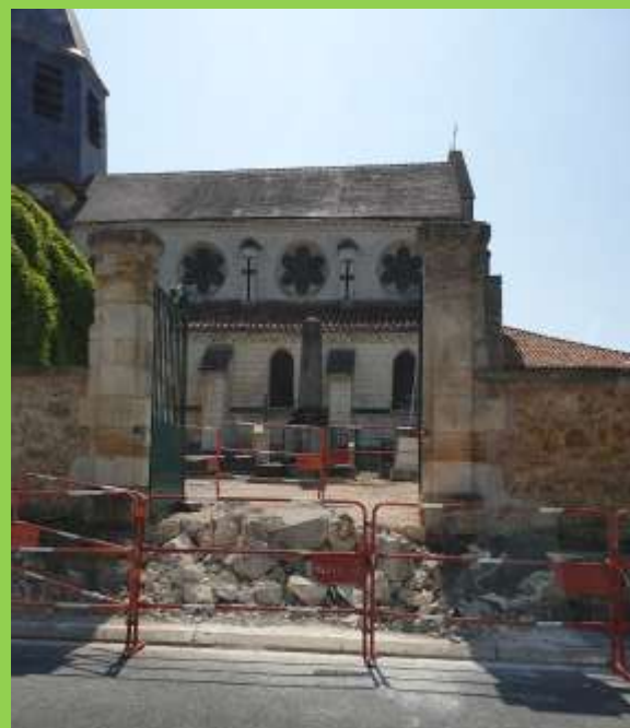
Aménagement de la rampe d'accès à l'église